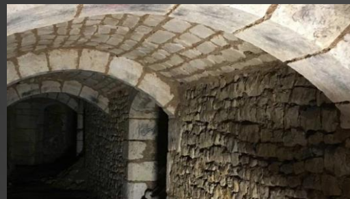
CM2 - LES ORMEAUX - Fontenay-aux-Roses