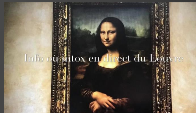
CM2 - SIMONE VEIL – Asnières

Le célèbre tableau de La Joconde exposé au musée du Louvre ne serait-il qu'une malheureuse copie ? Les journalistes enquêtent.