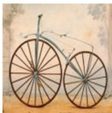
Cycle 3 – CM1 et CM2