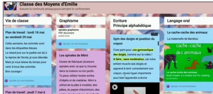
Exemple en maternelle

Maintenant que j'ai construit mon emploi du temps et mes progressions/programmations pour la période, je réalise un padlet et/ou un plan de travail que j'enverrai aux élèves et à leur famille.