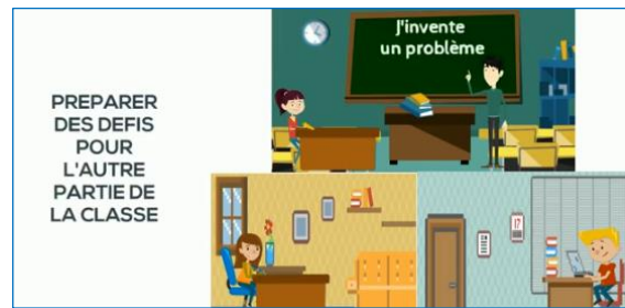
Exemples d'activités à partager